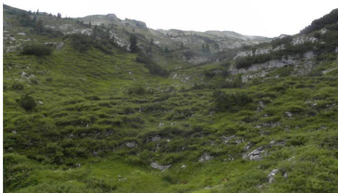
Gottesacker und Karstverwitterung

erholsam und entspannend. Das Wetter hat es sehr gut mit uns gemeint. Nass wurden wir durch erhöhte Transpiration von innen, nicht durch Regen von außen.